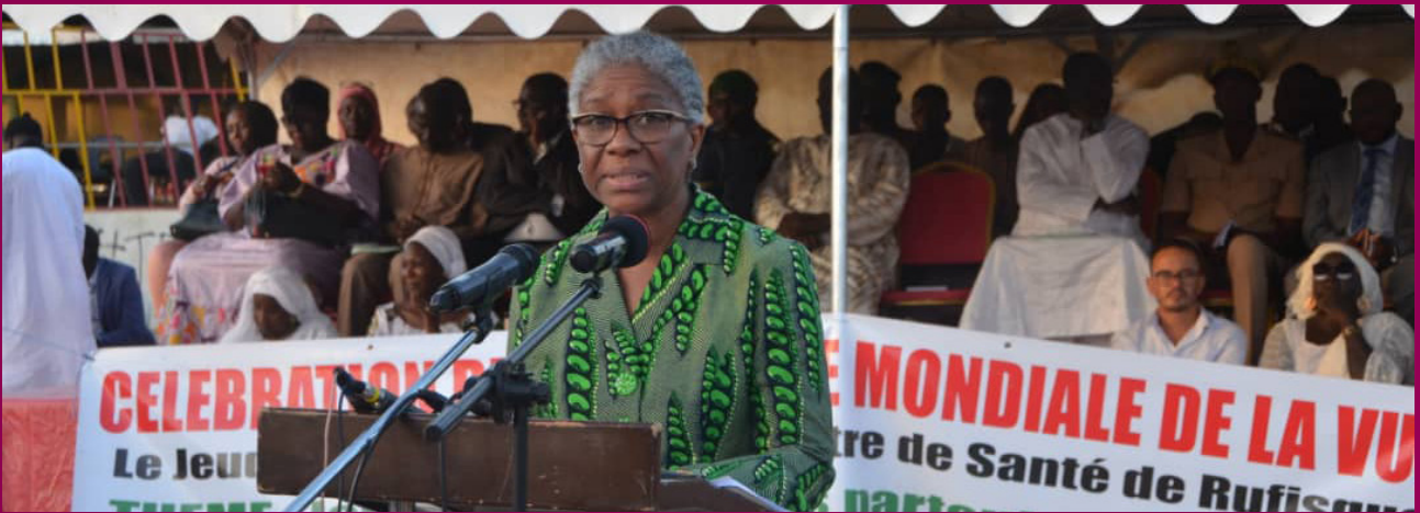
Célébrations de la Journée mondiale de la vue au Sénégal.