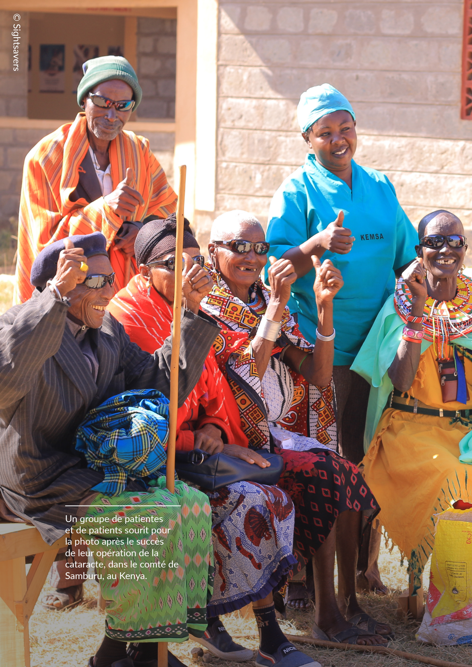
Un groupe de patientes et de patients sourit pour la photo après le succès de leur opération de la cataracte, dans le comté de Samburu, au Kenya.