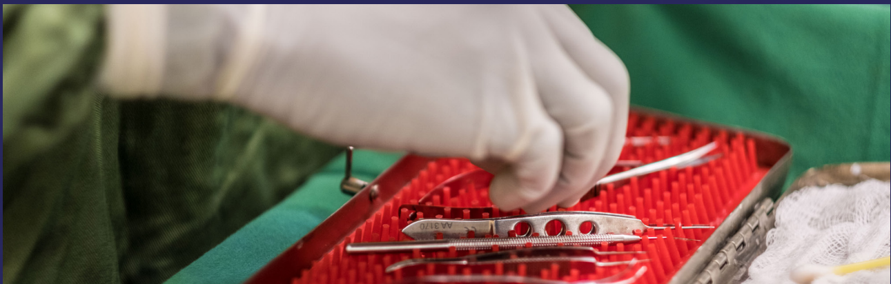
Instruments chirurgicaux utilisés lors d'une opération de la cataracte à Nampula (Mozambique).

Cible 1.2 : Aider les pouvoirs publics et les établissements partenaires publics et privés à fournir des services de santé oculaire de qualité, centrés sur la personne.